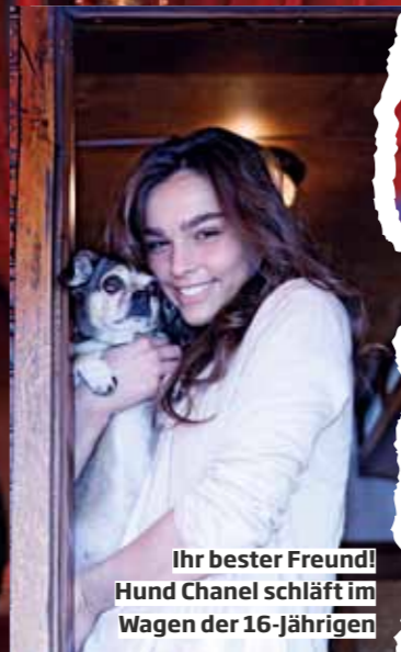
Ihr bester Freund! Hund Chanel schläft im Wagen der 16-Jährigen