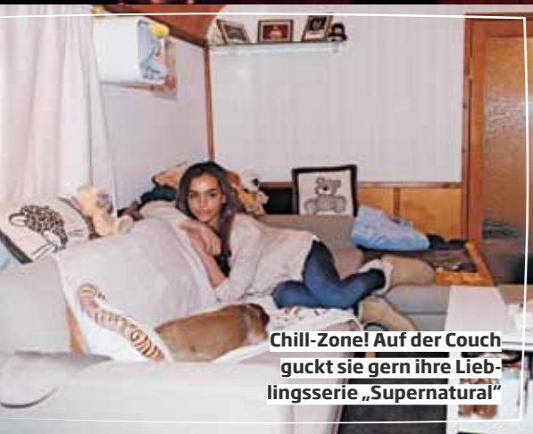
Chill-Zone! Auf der Couch guckt sie gern ihre Lieblingsserie „Supernatural“