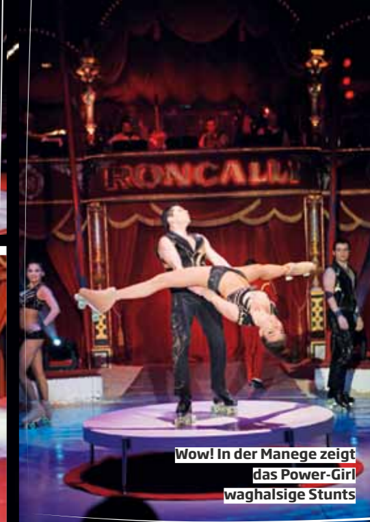
Wow! In der Manege zeigt das Power-Girl waghalsige Stunts