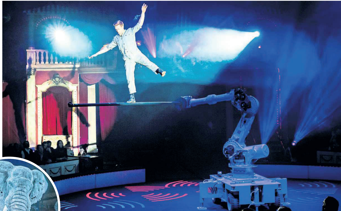
Hightech statt lebender Tiere: Das Roncalli-Konzept.