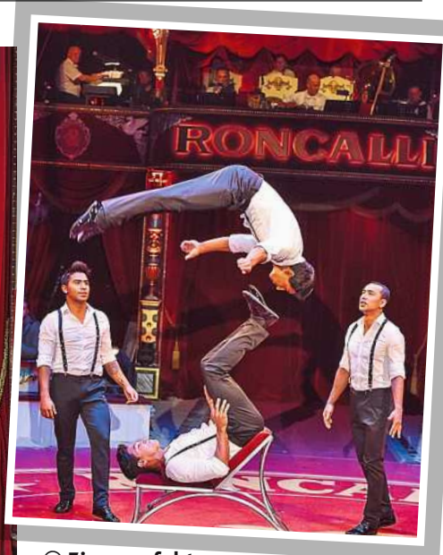
⊖ Eine perfekte Zirkus-Show lieferten die Roncalli-Künstler in Linz ab.