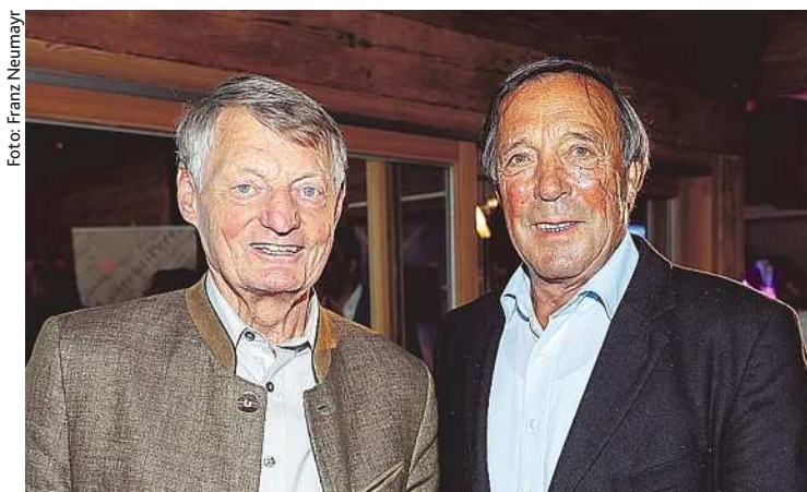
Mit dabei: Die Skilegenden Hias Leitner (li.) und Rudi Sailer.