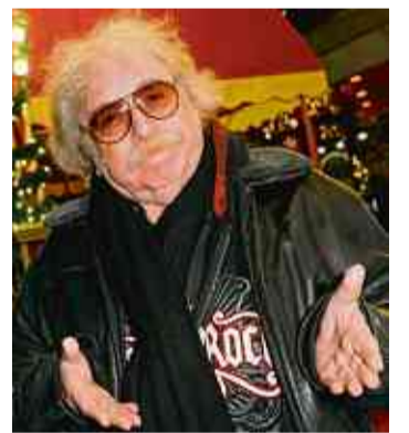
Bernhard Paul ist „Roncalli“- und „Apollo“-Chef.

Übrigens: Natürlich tun die Schönen alles, um bestens in Form zu bleiben - auch und vor allem an den Beinen. Deshalb trifft man sie vormittags ziemlich häufig im Fitness-Club „Holmes Place“ an der Königsallee.