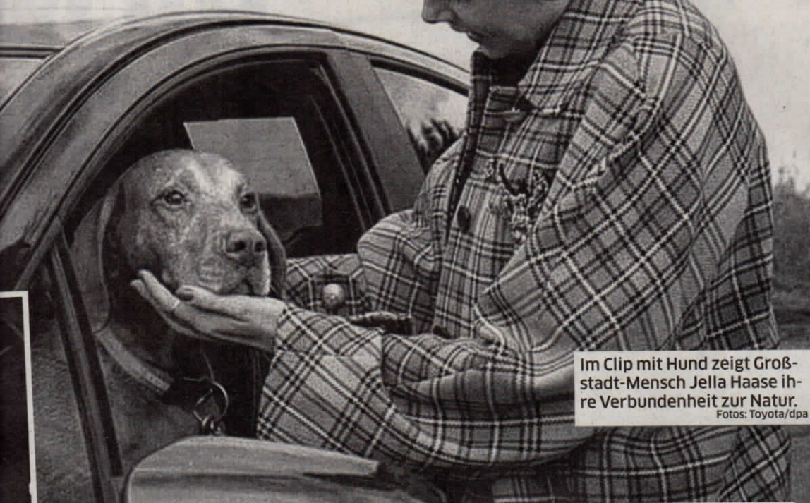
Im Clip mit Hund zeigt Großstadt-Mensch Jella Haase ihre Verbundenheit zur Natur.

Köln – Wer sie nur aus den Schüler-Spaß-Filmen „Fack ju Göhte“ kennt, wundert sich. Jella Haase stand jetzt für den Clip eines Kölner Autobauers vor der Kamera – ganz im Zeichen der Umwelt. Mit Kurzhaarfrisur, nachdenklichen Posen und Hund in coolem Schwarzweiß macht sie Werbung für den heutigen „Earth Day“. So anders als in ihrer Parade-rolle „Chantal“ lässt sie Star-Fotograf Jim Rakete aussehen.