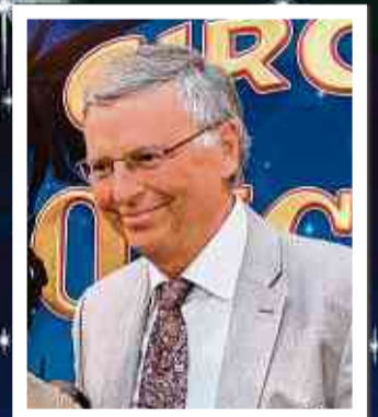
W. Bosbach: „Einzigartig“