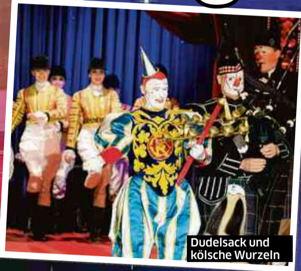
Dudelsack und kölsche Wurzeln

Köln – Märchenhaft, modern, bewegend. Als sich das Publikum zum Finale von den Plätzen erhob, war spätestens klar: Bernhard Paul hat seinen Circus Roncalli neu erfunden. Mit Pferden aus Lichtstaub, Heißluftballons, die über der Manege aufsteigen – aber erstmals ohne Tiere – und unzähligen Emotionen. Das neue „Circus-Theater“, das er seinen Premierengästen am Donnerstagabend präsentierte, verdient das Prädikat spektakulär.