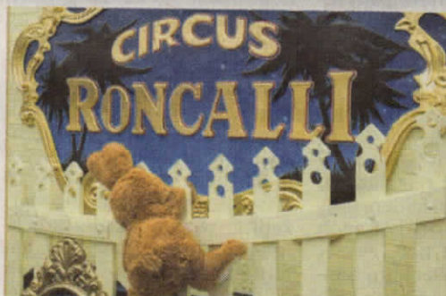
Der Osterhase klettert über den Zaun und gelangt so auf das Roncalli-Gelände. Im Anschluss reitet er auf einem Zirkuspferd durch das Zelt.

Mit einer kreativen Fotogeschichte punktete er bei unserem Wettbewerb. Neben vier Fotos hat er auch eine amüsante Erzählung in Form eines Zeitungsartikels eingereicht. „Einbruch am helllichten Tag: Dreister Osterhase steigt bei Roncalli ein“, lautet die Überschrift zu seinem Bericht. Weiter schreibt er: „Der Osterhase verschaffte sich illegal Zutritt zum Roncalli-Gelände, indem er über den Zaun kletterte. Später ritt er frech auf dem Zirkuspferd einige Runden durch das große Zelt. Dann versteckte er sich hinter einem Plakat, um nicht gesehen zu werden. Endlich wurde er von Security-Mitarbeitern gefasst, und wartet nun im Fundbüro auf das Eintreffen der Polizei.“