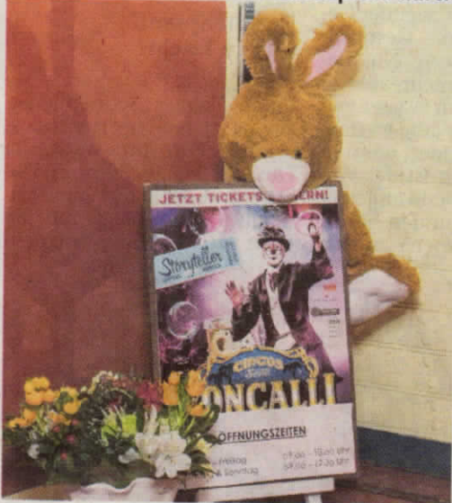
Später versucht er, sich hinter einem Plakat zu verstecken. Doch das Tier wird entdeckt und wartet im Fundbüro auf das Eintreffen der Polizei.