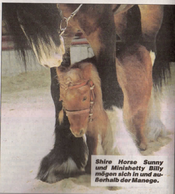
Shire Horse Sunny und Minishetty Billy mögen sich in und außerhalb der Manege.

den edlen Vierbeinern, die Tag für Tag das Publikum verzücken, Aaaahhs und Oooohhhs entlocken, Nummern einstudiert, sie umhegt und gepflegt. Denn: Das Wohlergehen seiner elf Schützlinge steht